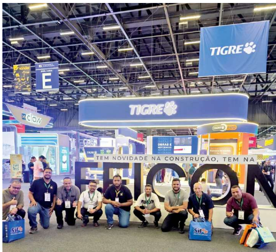
Usuários do Programa de Inclusão Produtiva na FEICON, em São Paulo