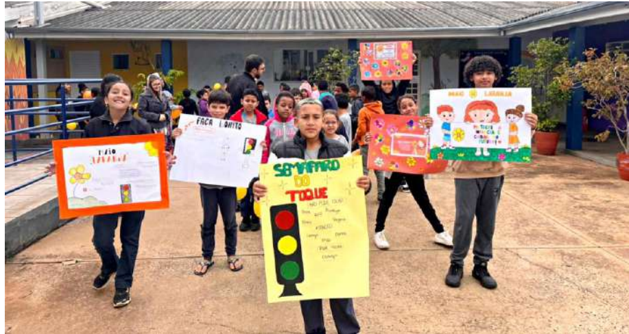
Crianças e adolescentes do Colmeia participam de passeata sobre o Maio Laranja