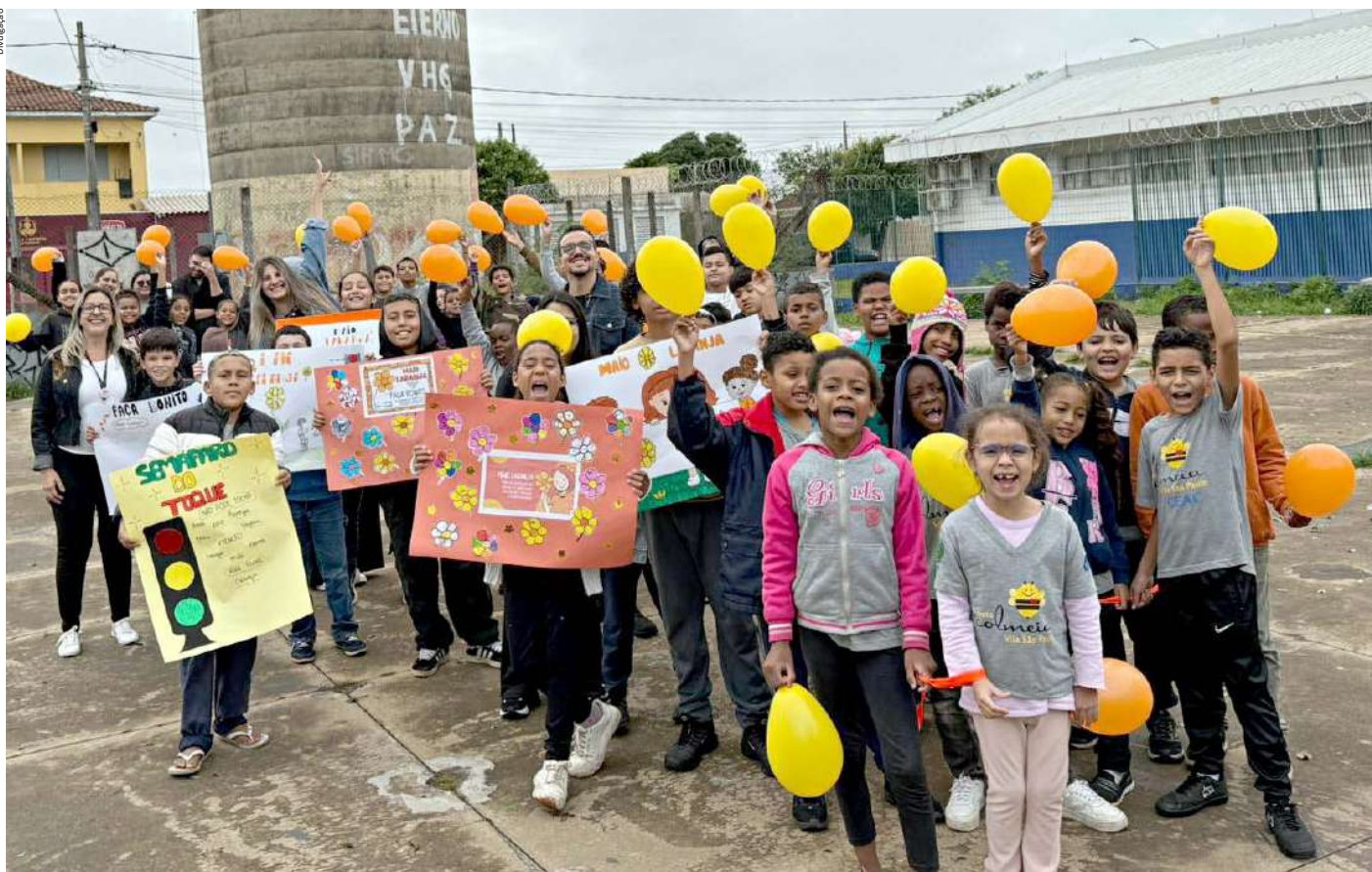
Crianças e adolescentes do Serviço de Convivência e Fortalecimento de Vínculos do Colmeia fizeram uma passeata pela VI. São Paulo

çam a importância das redes de proteção, do acesso a direitos e do investimento contínuo em políticas de desenvolvimento humano e fortalecimento comunitário. Veja as ações nesta edição.