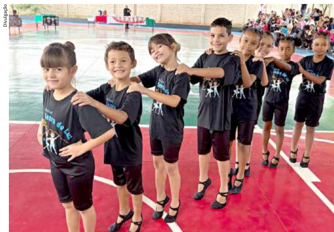
Apresentação de balé foi uma das atividades do Dia da Família