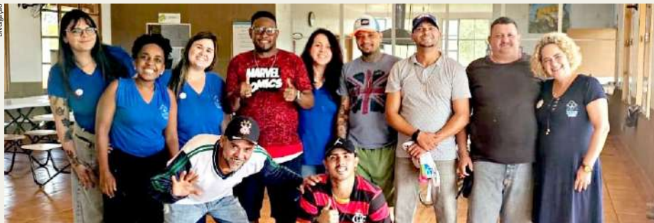
Equipe e usuários do Albergue Noturno, referência na rede social de alta complexidade

A Casa de Passagem - Albergue Noturno desempenha um papel fundamental na rede de proteção social do município, oferecendo acolhimento, escuta qualificada, orientação e suporte a pessoas em situação de vulnerabilidade social.