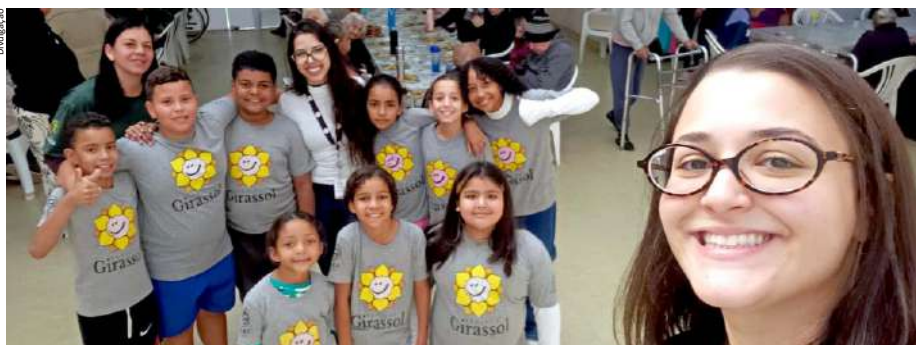
Participantes do Projeto Girassol durante visita à Associação Bauruense de Apoio e Assistência ao Renal Crônico

No dia 13 de maio, o Projeto Girassol participou de uma atividade intergeracional a convite do Centro Dia do Idoso da Associação Bauruense de Apoio e Assistência ao Renal Crônico (ABREC). A atividade proporcionou um momento especial de troca entre crianças, adoles-