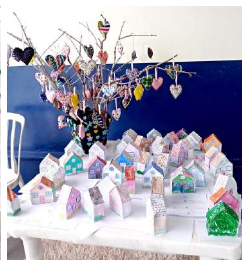
Lembranças feitas durante as oficinas foram entregues aos pais e responsáveis

O Serviço de Convivência e Fortalecimento de Vínculos (SCFV) do Crianças em Ação realizou em maio a celebração do Dia da Família. A iniciativa reforça a importância da participação familiar no desenvolvimento de crianças e adolescentes atendidos pelo serviço.