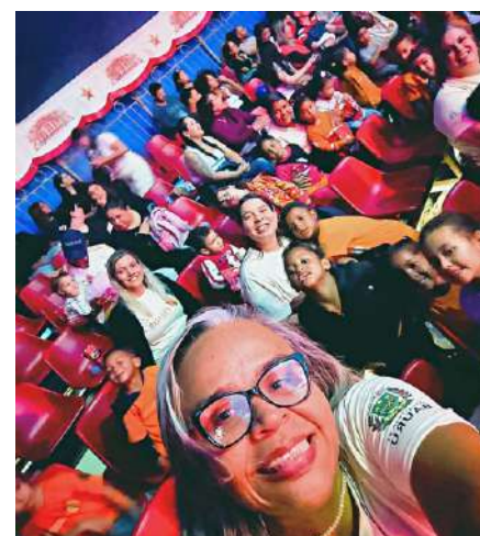
Crianças da Educação Infantil do Crescer assistiram, encantadas, ao circo

A equipe pedagógica e técnica destaca a importância de oferecer experiências fora da sala de aula, permitindo que as crianças aprendam por meio da vivência e da interação com diferentes espaços culturais.