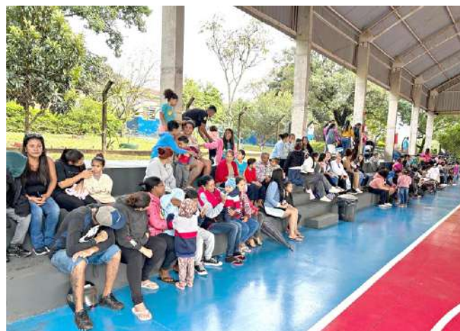
As famílias lotaram a quadra do Seara de Luz durante o evento

O Serviço de Convivência e Fortalecimento de Vínculos (SCFV) do Projeto Seara de Luz realizou, no dia 23 de maio, uma programação voltada ao Dia da Família.