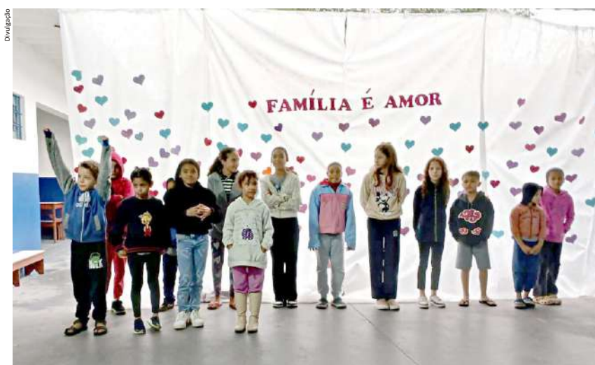
Apresentação foi especialmente desenvolvida pelas crianças e pelos adolescentes