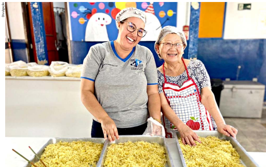
A produção do Yakissoba solidário uniu as equipes do Crescer e do Crianças em Ação

O objetivo de proporcionar recursos para atividades sociais a crianças e adolescentes atendidos pelo Centro Espírita Amor e Caridade uniu as equipes dos projetos Crescer e Crianças em Ação.