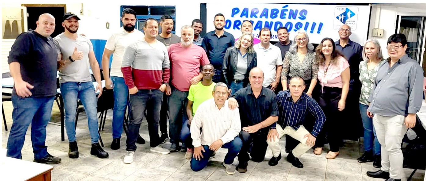
Formandos e representantes do Jardim Ferraz e do CRAS na formatura do Inclusão Produtiva

O Programa Inclusão Produtiva, do Núcleo Jardim Ferraz do Centro Espírita Amor e Caridade (CEAC), promoveu em julho a solenidade de formatura de usuários dos cursos de Comandos Elétricos e Elétrica Básica.