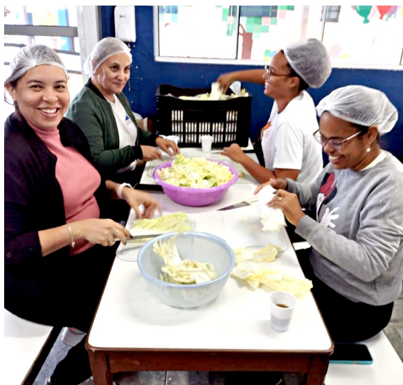
Voluntários realizam a higienização e corte de vegetais para a produção do yakissoba