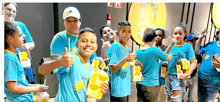
Crianças atendidas pelo Seara de Luz participaram de uma sessão de cinema nas férias

As férias do Projeto Seara de Luz resultaram em momentos de muita alegria, diversão e conhecimento às crianças e aos adolescentes atendidos. Em julho, a programação incluiu