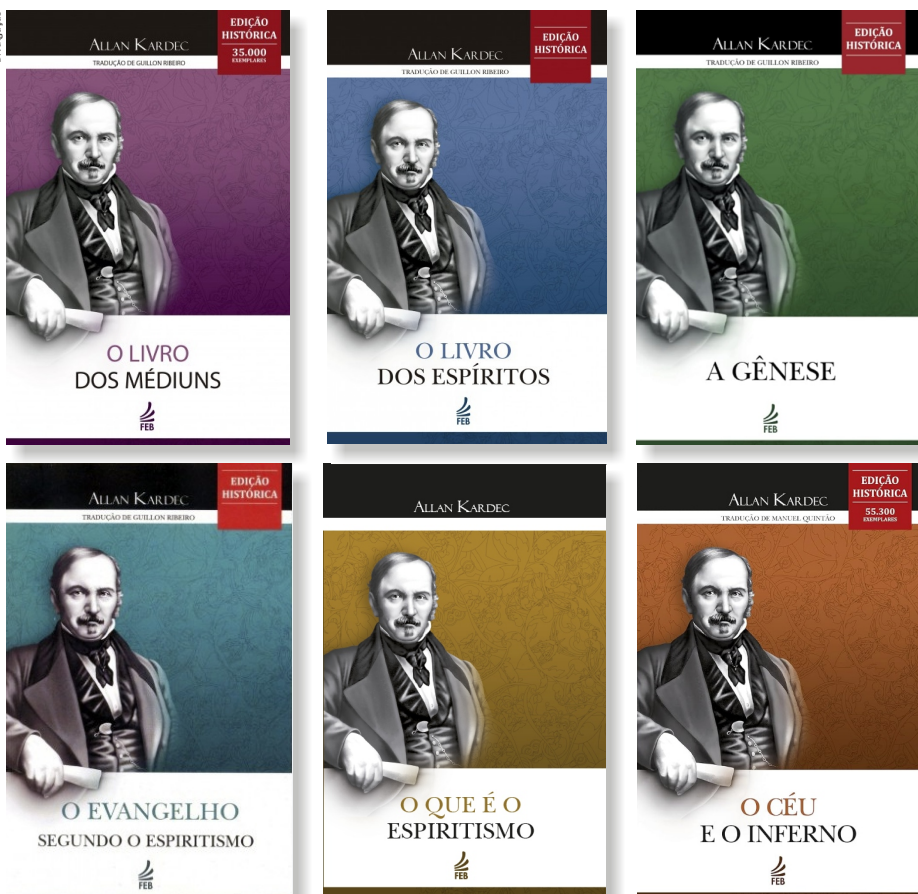
As obras básicas de Allan Kardec são referências nos estudos dos cursos sobre Espiritismo do CEAC

A UNICEAC, órgão do Departamento de Doutrina do Centro Espírita Amor e Caridade, está com inscrições abertas para o Módulo Básico do sistema unificado de estudos espíritas do CEAC, Curso de Orientação Espírita e Mediúnica (COEM), Estudo Sistematizado da Doutrina Espírita (ESDE) e Estudo da Mediunidade.