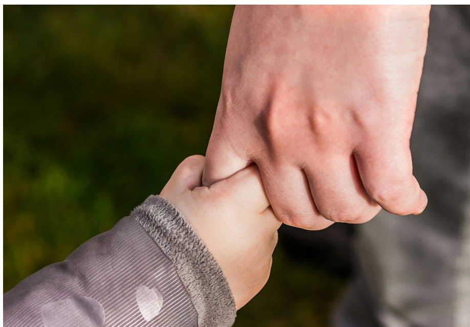
Encontros do Grupo Aulas da Vida refletem sobre a qualidade da paternidade

A relação entre pais e filhos inspira os encontros do Grupo Aulas da Vida em agosto.