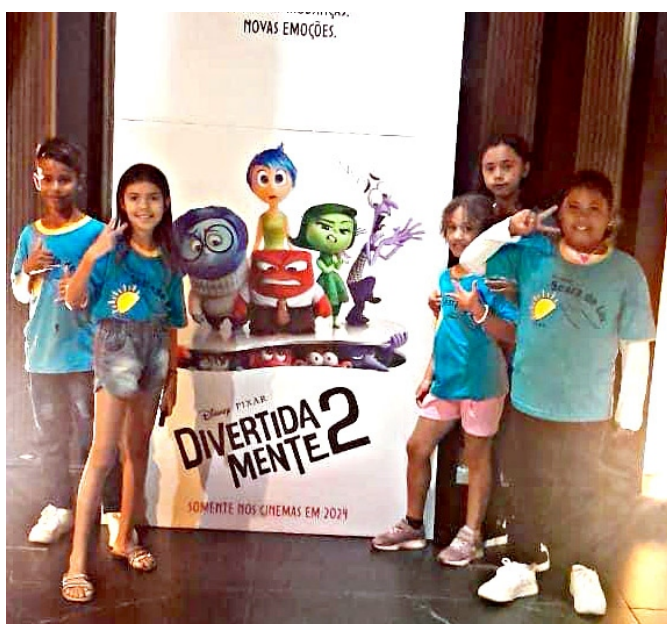
Crianças em frente ao cartaz do filme “Divertidamente 2”, assistido durante as férias