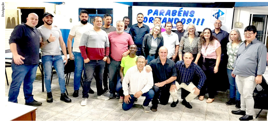
Formandos e representantes do Jardim Ferraz e do CRAS na formatura da Inclusão Produtiva