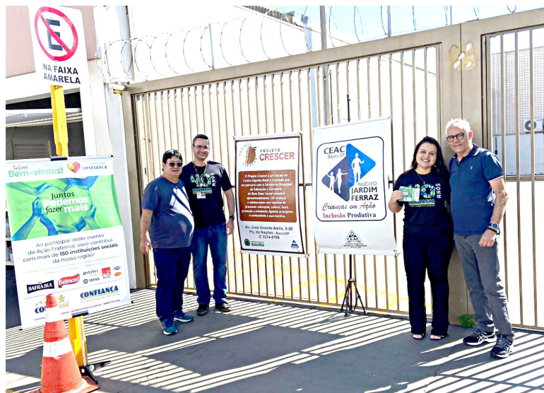
Representantes dos projetos Crescer e Crianças em Ação no estacionamento do CEAC

União, alegria e dedicação marcaram a atividade filantrópica Yakissoba, realizada em julho pelos projetos Crianças em Ação e Crescer como parte das atividades de manutenção de suas ações sociais.