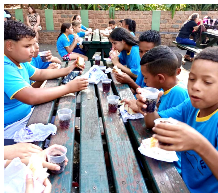
No Zoo de Bauru, a visita contemplou diversos setores e teve piquenique

O mês de férias no Projeto Seara de Luz teve programação especial, com muitas atividades recreativas e de lazer proporcionadas às crianças e aos adolescentes atendidos.